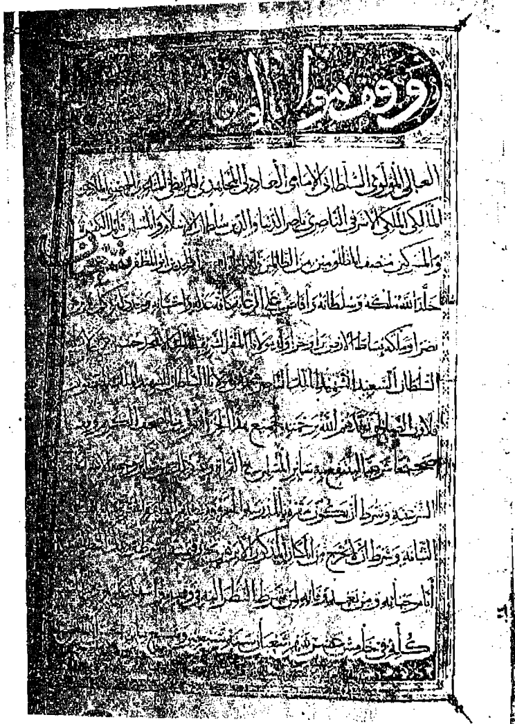
الصفحة الاولى من مصحف السلطان شعبان بن حسين وعليها نص الوقفية بتاريخ ١٥ شعبان سنة ٧٧٠ هـ على مدرسته، (دار الكتب، ٩ مصاحف).